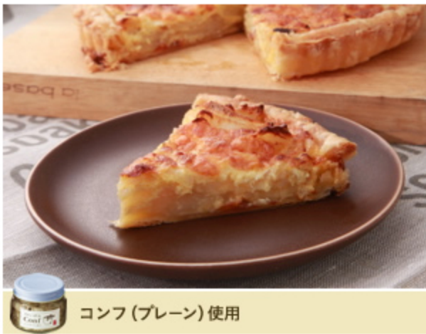
コンフ(プレーン)使用