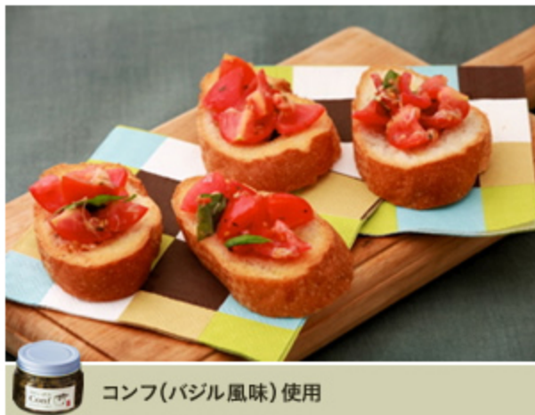
コンフ(バジル風味)使用