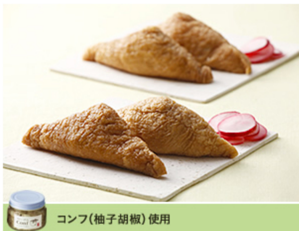
コンフ(柚子胡椒)使用