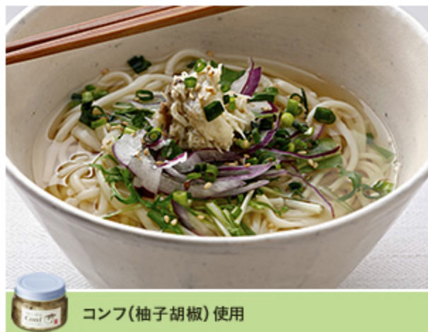
コンフ(柚子胡椒)使用