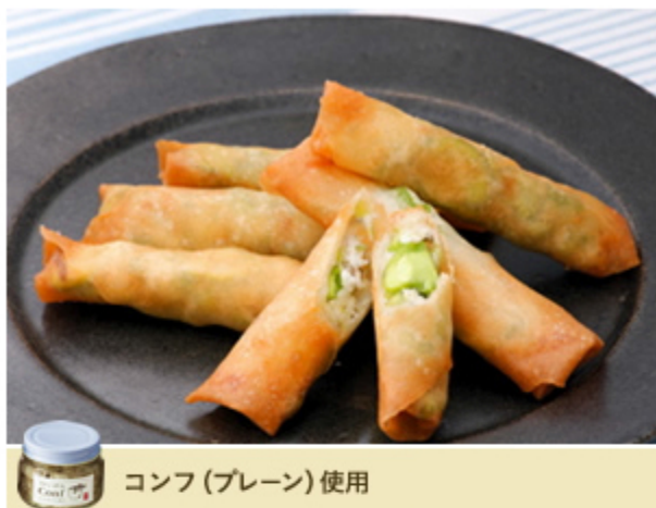
コンフ (プレーン) 使用